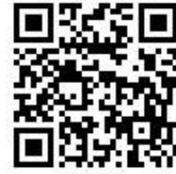
桃園市國民小學藝術才能美術班 鑑定線上報名系統